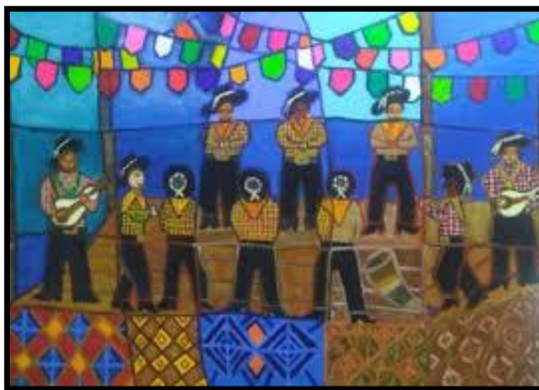
O Catira, Acrílica sobre tela, 2018